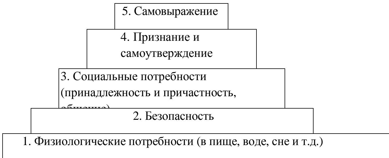
Рис. 2. Пирамида потребностей А. Маслоу

они находятся в иерархическом расположении по отношению друг к другу: