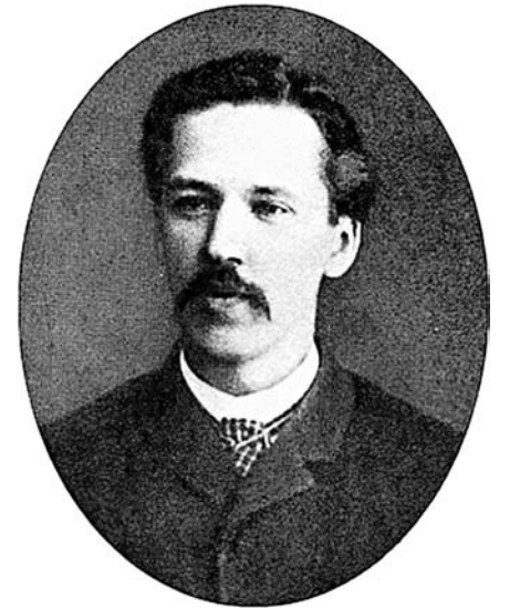
Сергей Зубатов (1864 - 1917 гг.)

мом» лишено всякого смысла. С социализмом она боролась, защищая принципы частной собственности в экономической жизни страны, и экономической её программой был прогрессирующий капитализм, осуществляющийся в формах всё более культурных и демократических (почему-то кажущихся нашим российским капиталистам «антикапиталистическими»). Полицейские меры, как чисто внешние, опять-таки её не занимали, ибо она искала такой почвы для решения вопроса, где бы всё умиротворялось само собой, без внешнего принуждения.