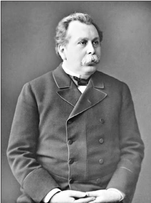
Вячеслав Константинович фон Плеве

«Приглядываясь, по обязанностям службы, к русскому революционному движению, как среди интеллигентных слоев населения, так и среди рабочих, мне всё более и более приходилось убеждаться, какое почти всеисчерпывающее значение имеет среди людей чувство доверия и вообще честные отношения; стоило только, бывало, беседуя, преодолеть в