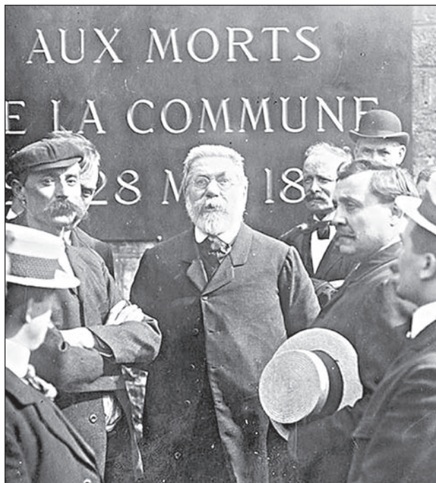
Председатель конгресса II Интернационала Эдуард Вайян ▲ Деятель немецкого рабочего движения Вильгельм Либкнехт ►

130 лет назад Учредительный конгресс II Интернационала проголосовал за 8-часовой рабочий день и празднование Первомая